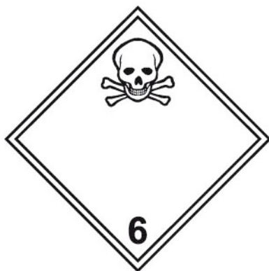
Rótulo Peligro Principal