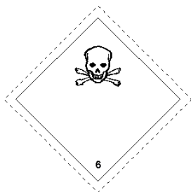
Rótulo Peligro Principal